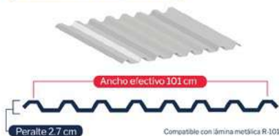
Lámina T-18 (R-101)