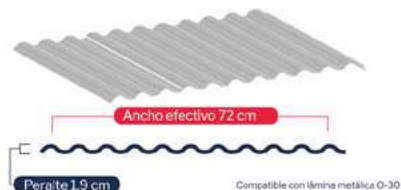
Lámina T-60 (0-30)