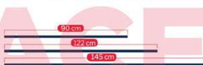
Lámina T-50 (plana / lisa)