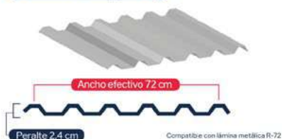
Lámina T-8 (R-72)